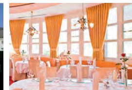
VILA VITA Pannonia****