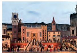
Opernfestspiele St. Margarethen