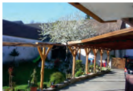
Heuriger Schemitz mit angeschlossener Vinothek