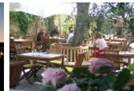
Wirtshaus im Hofgassl