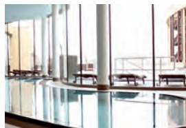
St. Martins Therme &amp; Lodge